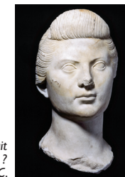
Portrait famille impériale ? 1 er siècle avant J.-C.

sont présentées au public à partir de 1968. Les sculptures antiques majeures de Glanum* y sont aujourd'hui mises en valeur. Un parcours permet de découvrir, de la fouille au laboratoire, les différentes étapes de la recherche archéologique menée par les scientifiques depuis un demi-siècle.